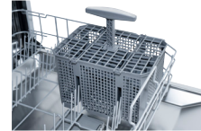
Besteckkorb Herausnehmbar zum einfachen Sortieren des Bestecks