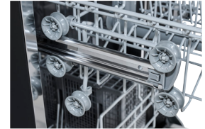
Höhenverstellbarer Oberkorb Flexibel durch höhenverstellbaren Oberkorb