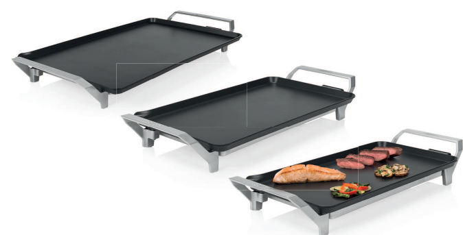
Table Chef Premium Table Chef Premium XL | Table Chef Premium XXL 01.103100.01.001 | 01.103110.01.001 | 01.103120.01.001

PARTS DESCRIPTION / ONDERDELENBESCHRIJVING / DESCRIPTION DES PIÈCES / TEILEBESCHREIBUNG / DESCRIPCIÓN DE LAS PIEZAS / DESCRIÇÃO DOS COMPONENTES / DESCRIZIONE DELLE PARTI / BESKRIVNING AV DELAR / OPIS CZĘŚCI / POPIS SOUČÁSTÍ / POPIS SUČASTI / ОПИСАНИЕ ЗАПЧАСТИ