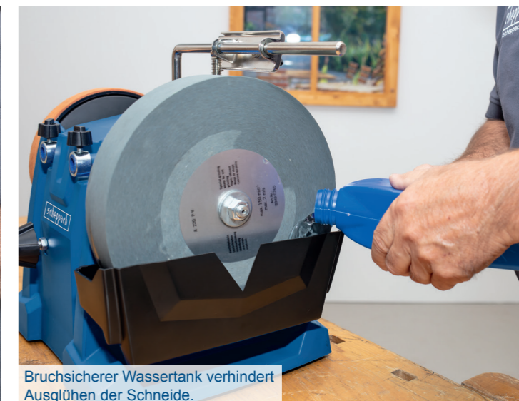
Bruchsicherer Wassertank verhindert Ausglühen der Schneide.