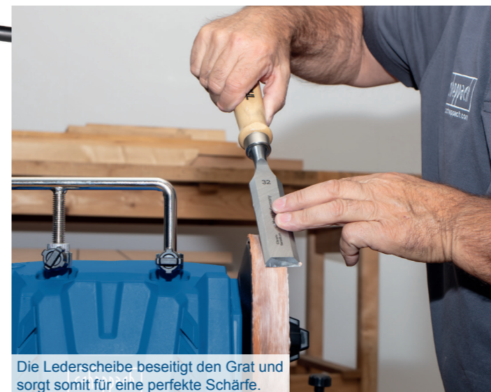
Die Lederscheibe beseitigt den Grat und sorgt somit für eine perfekte Schärfe.