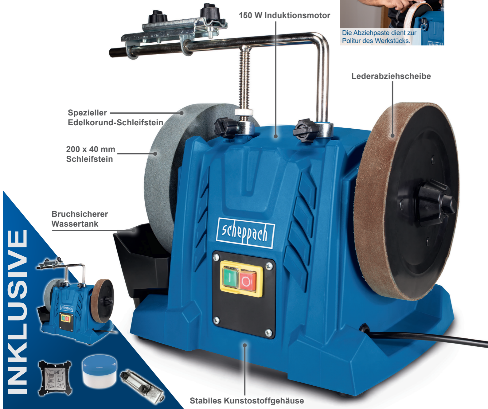
150 W Induktionsmotor