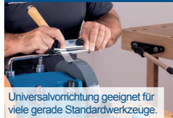
Universalvorrichtung geeignet für viele gerade Standardwerkzeuge.