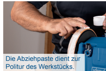
Die Abziehpaste dient zur Politur des Werkstücks.