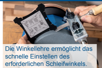
Die Winkellehre ermöglicht das schnelle Einstellen des erforderlichen Schleifwinkels.