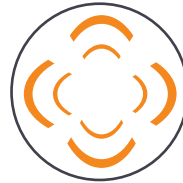
Hindernisvermeidung in 4 Richtungen