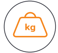
Gewicht ca. 595 Gramm