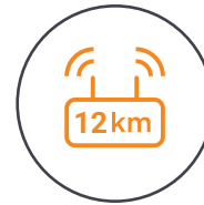
Bis zu 12 km Full HD Übertragungsbereich