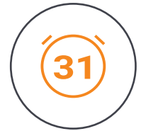
Max. 31 Minuten Flugzeit