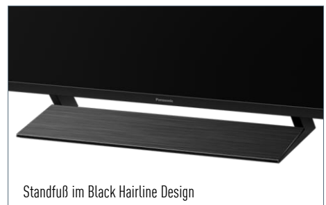
Standfuß im Black Hairline Design