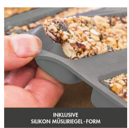
INKLUSIVE SILIKON MÜSLIRIEGEL-FORM