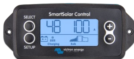
SmartSolar pluggable display

Simply remove the rubber seal that protects the plug on the front of the controller, and plug-in the display.