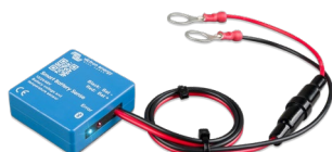
Bluetooth sensing: Smart Battery Sense