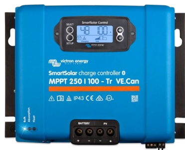
SmartSolar Charge Controller MPPT 250/100-Tr VE.Can with optional pluggable display