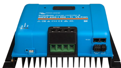
SmartSolar Charge Controller MPPT 250/100-Tr VE.Can without display