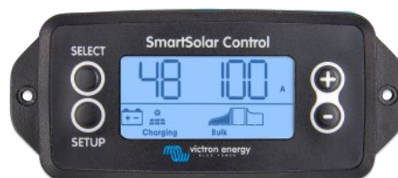
SmartSolar einsteckbares Display