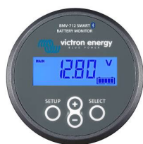
Bluetooth sensing: BMV-712 Smart Battery Monitor