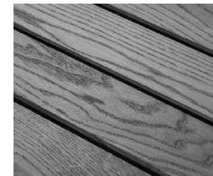
Natürlicher Farbton behandelter Klickfliesen

Nun kann das Öl gleichmäßig aufgetragen werden. Hier eignet sich ein handelsübliches Pflegeöl für Holz. Wir empfehlen jedoch ein Öl mit hohem UV-Schutz zu verwenden. Durch das Öl werden die Poren verschlossen und Verschmutzungen können sich nicht mehr so einfach festsetzen. Das erleichtert die Reinigung im Nachhinein.