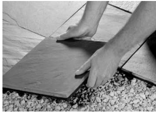
Schnell & einfach auf- und abbauen