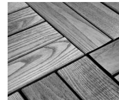
Natürlicher Farbton nach einigen Monaten ohne Behandlung