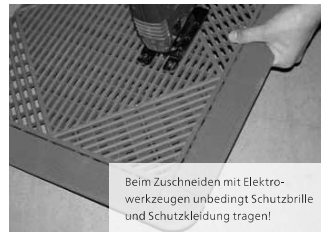
Falls nötig zuschneiden

Beim Zuschneiden mit Elektrowerkzeugen unbedingt Schutzbrille und Schutzkleidung tragen!