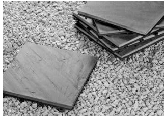
Verlegung ohne Kleber oder Fugenmörtel