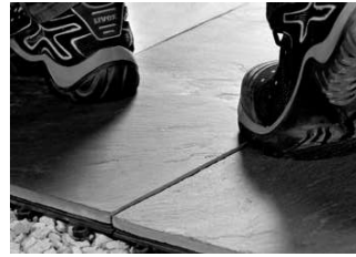
Sofort begeh- und belastbar