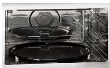
Seitenwandprägung für Glasfettpfanne