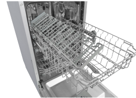
Geschirrkorb Verstellbar für Ihre Anforderun- gen.