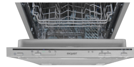
Bedienblende Einfache und intuitive Programm- meinstellung.