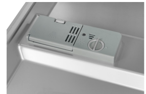
Spülmittelkammer Perfekte Dosierung für jeden Spülgang.