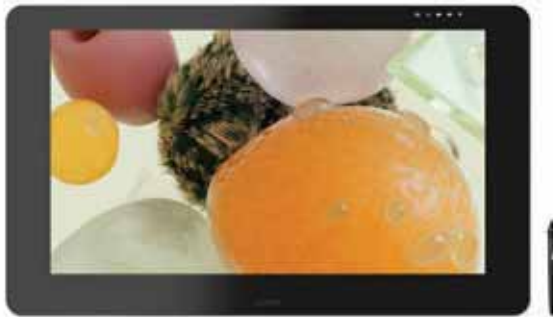
Künstler: David McLeod

Wacom Cintiq Pro 32 und 24 sind hochentwickelte Kreativ-Stift-Displays. In Verbindung mit dem Wacom Pro Pen 2 machen sie jeden kreativen Durchbruch noch besser.