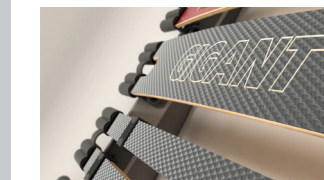
Extrabreite Systemleiste im Lendenbereich für stabilen Liegekomfort.

Ab einer Breite von 160 cm wird die Unterfederung zweiteilig geliefert.