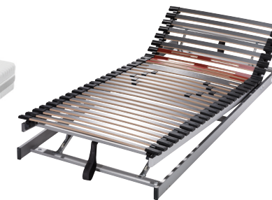
GIGANT 30 Plus