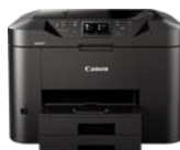
MAXIFY MB2750 Modelle