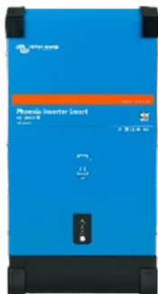
Phoenix Wechselrichter Smart 12/3000