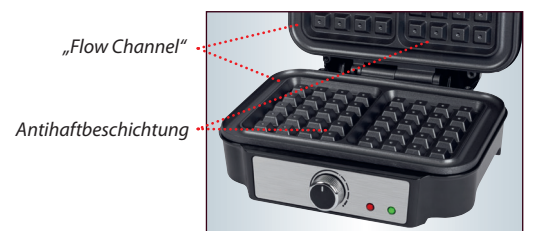
Extra leichte Reinigung: - Antihftbeschichtete Backflächen - „Flow Channel“