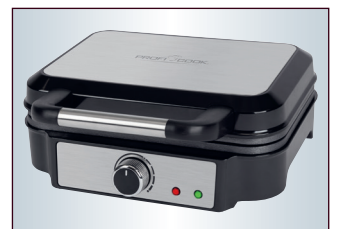
3 Edelstahleinlagen: Deckel, Griff und Front