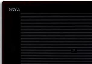
EKI 8050/4 Flex