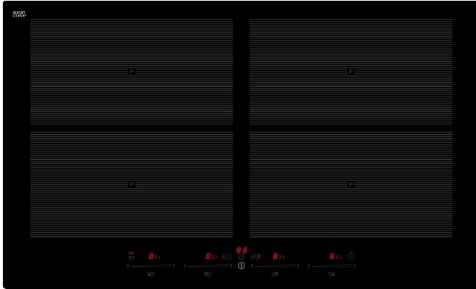
EKI 8050/4 Flex