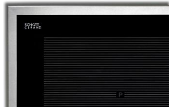
EKI 8050/4 R Flex