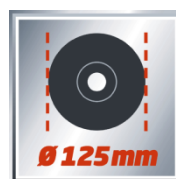
Ø 125 mm