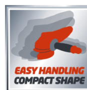
EASY HANDLING COMPACT SHAPE