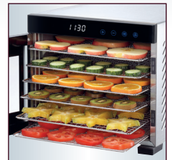
Inkl. 6 Edelstahl-Ablagegitter/ Dörrtablets für unterschiedliches Dörrgut

*) Bei der Verarbeitung/Trocknung von besonders wasserhaltigen Lebensmitteln wie z. B. Äpfeln, Ananas usw.