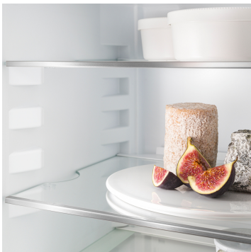
Komfort-Höhenverstellung für Glasplatten

Wenn Sie eine Karaffe oder hohe Behältnisse im Kühlschrank lagern, möchten Sie dafür nicht gleich eine ganze Glasplatte entfernen müssen. Warum auch? Schließlich gibt es die teilbare Glasplatte: Schieben Sie einfach die vordere Hälfte der Glasplatte unter die hintere Hälfte. So können Sie vorne höhere Behälter einstellen und haben dennoch genug Platz für andere Lebensmittel.