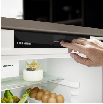
Touch & Swipe-Display

Ihr Liebherr gehorcht Ihnen auf Fingerzeig: Dank Touch & Swipe-Display bedienen Sie Ihren Kühlschrank intuitiv und kinderleicht. Wählen Sie einfach Funktionen wie „SuperCool“ auf dem farbigen Display per Tippen und Wischen aus. Genauso leicht regeln Sie auch die Temperatur. Und wenn Sie das Display nicht aktiv bedienen? Dann zeigt es Ihnen die Ist-Temperatur an.