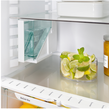
IceMaker mit Wassertank

Der IceMaker mit 1,5-Liter-Wassertank stellt eine innovative Lösung bei ungenügender Wasserqualität bzw. fehlender Wasserleitung zur Verfügung. Er lässt sich zum Befüllen bequem entnehmen.