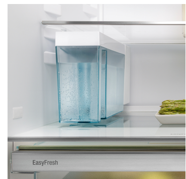
IceMaker mit Wassertank

Echt berührend: Durch das Touch-Display bedienen Sie Ihren Liebherr einfach und intuitiv. Auf dem Display sind alle Funktionen übersichtlich angeordnet. Mit einem leichten Fingertipp wählen Sie zum Beispiel mühelos die Funktionen aus oder prüfen die aktuelle Temperatur Ihres Kühlgeräts.