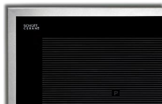
EKI 6050/4 R Flex