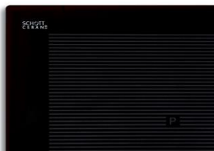
EKI 6050/4 Flex