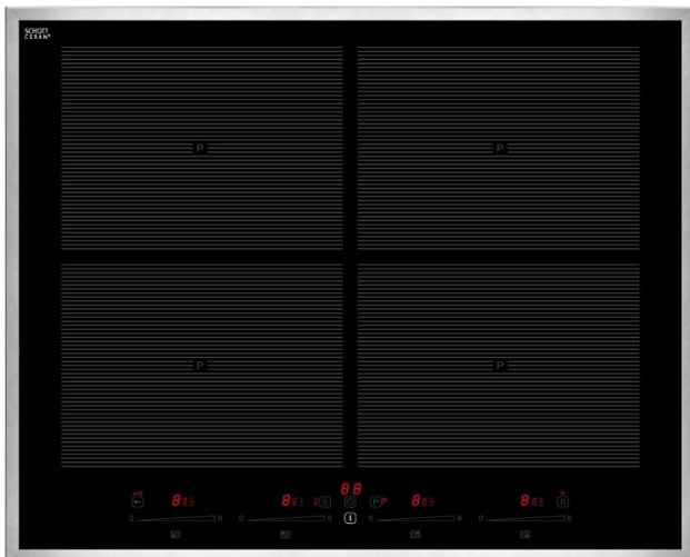
EKI 6050/4 R Flex