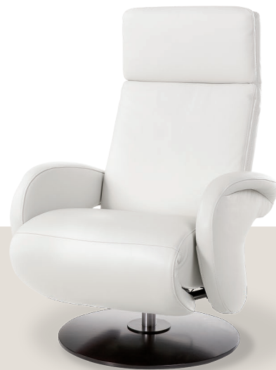
Bezug: Z73/43 cream white

Sitzkomfort empfindet jeder anders - und genau darauf geht das ergorelaxx -Programm ein. Das Kopfteil ist stufenlos verstellbar. Die Rückenlehnen lassen sich durch einfache Gewichtsverlagerung bequem nach hinten neigen. Weitere Verstellmöglichkeiten bestehen manuell (via Einsatz einer Gasdruckfeder) oder motorisch. Design: Wilhelm Bolinth