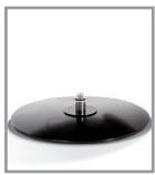
Holzteller, versch. Beiztöne - FU2, Aufpreis F U2