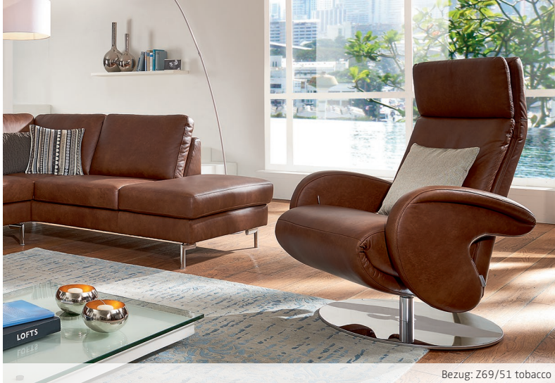
Bezug: Z69/51 tobacco

Hier zeigen wir Ihnen mögliche Zusammenstellungen des Modells in ausgewählten Bezügen auf. Lassen Sie sich inspirieren!