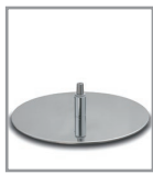
Drehteller, Chrom glänzend - FU 3, Aufpreis F PG