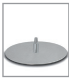
Drehteller, matt - FU 3, Aufpreis F PM