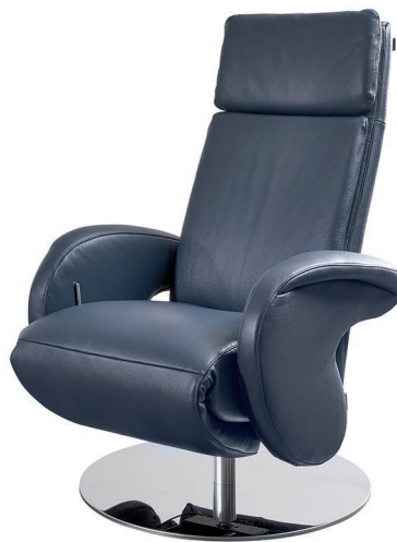
Bezug: Z71/29 blau