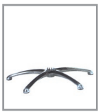
Sternfuß Chrom glänzend - FU 1 F SG