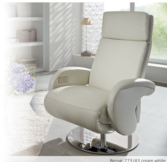
Bezug: Z73/43 cream white