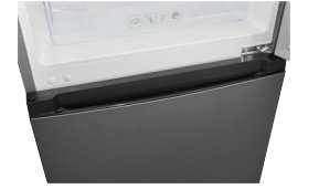
Türeingriff Mit dem Griff lässt sich das Gerät leicht öffnen.