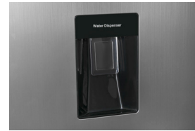
Wasserspender Jederzeit bequem gekühltes Wasser entnehmen.