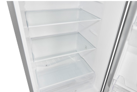
Glasböden Die Einsatzhöhe der Glasböden lässt sich ganz nach ihren Wünschen konfigurieren.