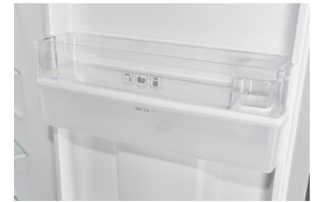
Wassertank Integrierter Frischwassertank (2,5 Liter Nutzinhalt)