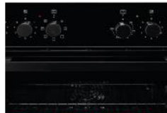
Bedienblende ohne Uhr Übersichtliche Bedienelemente