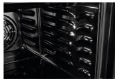
Geprägter Garraum Ermöglicht eine einfache Reinigung und ein müheloses