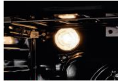
Beleuchtung Helle Beleuchtung des Innenraums