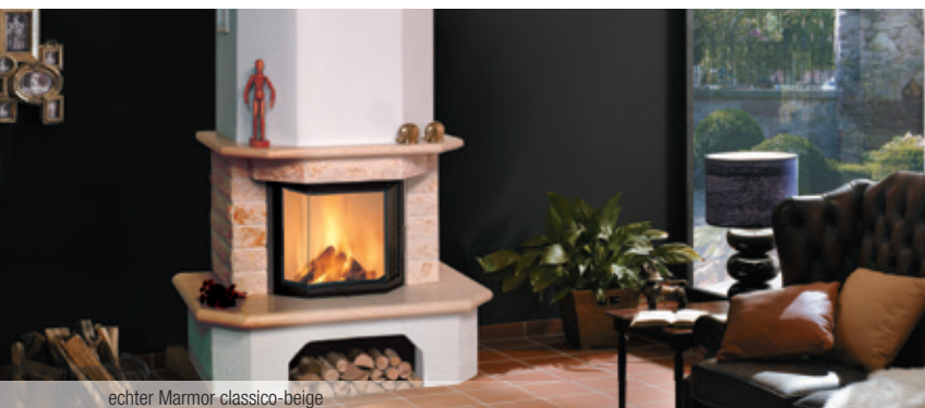
echter Marmor classico-beige